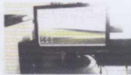
COMPUTADORA, MAUS, TECLADO, BOSINAS