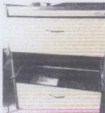
MUEBLE DE MADERA COLOR CERESO CON TRES CAJONES