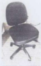
SILLA SECRETARIA JIRATORIA