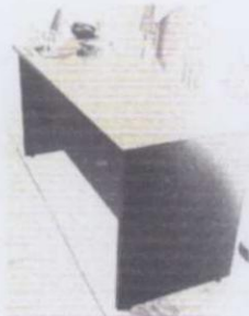
ESCRITORIO SECRETARIAL DE MADERA COLOR CERESO Y NEGRO CON DOS CAJONES