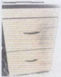
MUEBLE DE MADERA COLOR CERESO CON DOS CAJONES