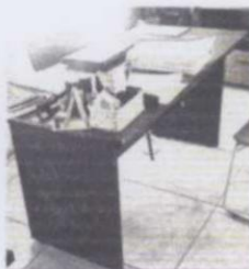
ESCRITORIO SECRETARIAL DE MADERA COLOR CERESO Y NEGRO SIN CAJONES