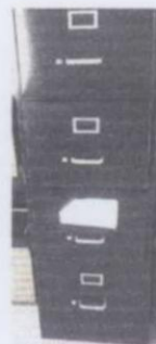
ARCHIVERO METALICO NEGRO DE CUATRO GABETAS